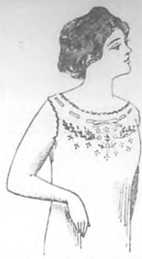
Bonito Camión de hilo puro bordado y festoneado en todas las tallas y variados en más de 50 dibujos a $1.75.

ESPECIALIDAD EN EQUIPOS PARA NOVIA Neptuno 22. Teléfono A-7166. Habana.