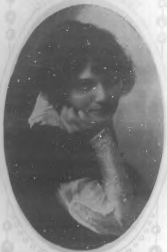
EMILIA BERNAL Notable poetisa camagüeyana.