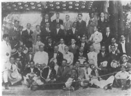
Grupo de concurrentes al almuerzo con que los estudiantes del Quinto año, de Nuestra Universidad, obsequiaron a sus profesores, en la tarde del día 18 del actual en los Jardines de "La Tropical.

Fiestas en Cárdenas. Las del 20 de Mayo, en conmemoración de la gloriosa fecha de la independencia han sido muy rejosiadas; se han celebrado con inmensa alegría tomando parte en ellas todos los habitantes de dicha ciudad.