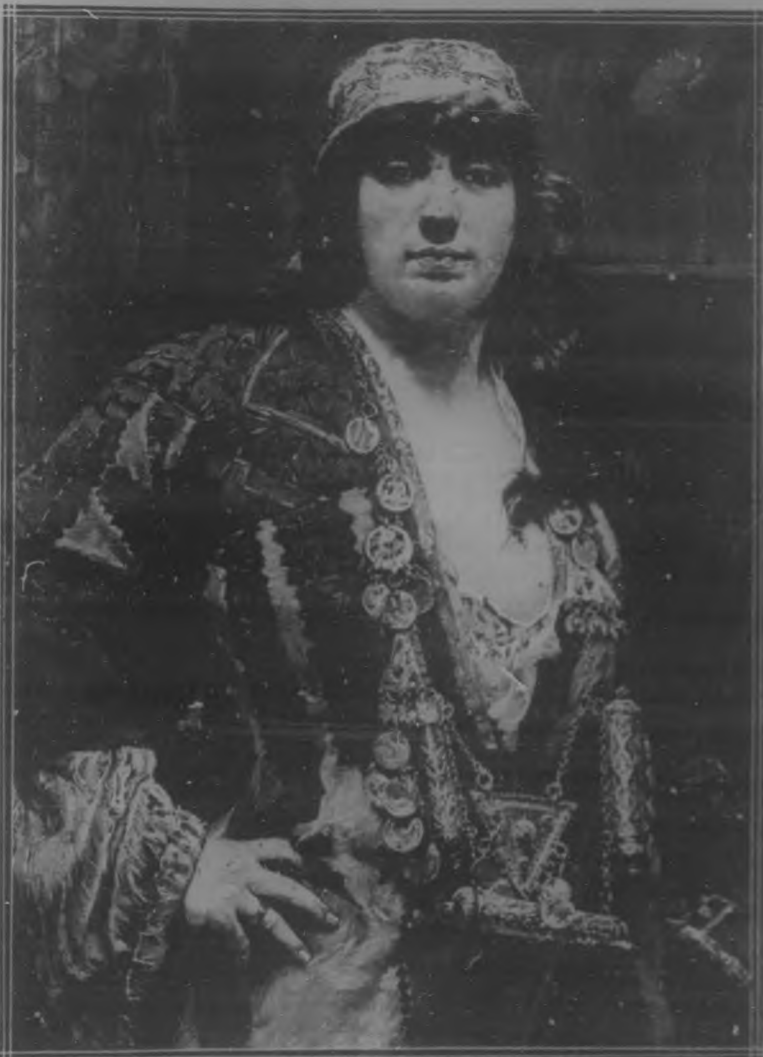
"JOVEN ARGELINA" Cuadro de D. Ramón Tusquets.