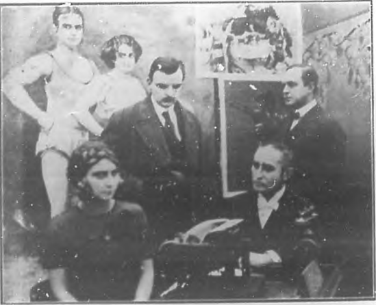
Una mirada amenazadora de mi amante, me impuso silencio

El derredor del Dr. Dupont, nuestros asientos formaron un semicírculo. El ilustre sabio me hizo una pregunta del Hospital de San Ambrosio, no había prometido narrarnos algo más interesante sobre Elsie , la celebre ecuyere que acababa de morir, paratífica y sola, la mesa de operaciones... a todos sus antiguos admiradores con su apellido... Y el doctor cumplió su promesa.