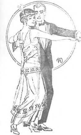
Lám. Núm. 14.

Tratado completo de bailes de sociedad. Lecciones fáciles y prácticas para aprender el One Step, Walking Boston, Hesitation Waltz, Dream Waltz, Tango Argentino y Fox-Trot. Por Miss Josephine Clements. Ilustraciones de A. R. Maribona.