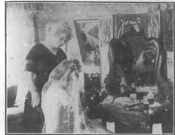
Cuando me ví ante el espejo, prendido a mis cabellos el albo velo de desposada....

Dijo el otro, y entonces ambos se enredaron en una discusión prolija sobre las ventajas del éter y del clorofórmo como hipnoestésicos. —La del clorofórmo,—gritaba el anciano,—es sucesión mucho más rápida que la del éter. Asimismo el fenómeno de trastorno, en las vías respiratorias, es mucho menos pronunciado a causa de su poca diracción. Por el mismo motivo, la excitación general; la ebrioididad y el delirio duran mucho menos con el clorofórmo que con el éter. Impulsó el otro médico silencio, con el dedo, alejándose entonces ambos de mi lecho. No obstante hablar a distancia y en voz baja, seguía escuchándolos claramente. El éter prestaba tal agudeza a mi oído que no perdí una sílaba de la discusión.