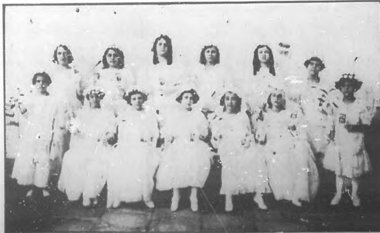
EN EL COLEGIO "CURBELO-HERNANDEZ.—Grupo de alumnas que tomaron la primera comunión.

Consignamos con placer la llegada a la Habana de un cubano ilustre, el gran dibujante Olivera, cuya cosecha de lauros ha sido fecundísima en Madrid.