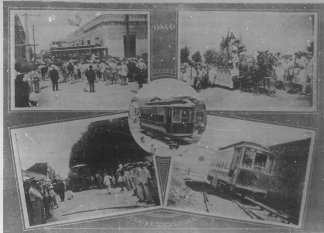
LOS PROGRESOS DE LA CIUDAD DE CARDENAS Y EL 30 DE MAYO.—Distintas fotografías tomadas con motivo de la inauguración del tranvía eléctrico en dicha bella Ciudad.—En una de las vistas figura la carroza patriótica de la Junta de Educación que acompañó a los niños de las escuelas municipales, hasta el monumento de los mártires, donde colocaron flores, en las fiestas patrióticas del 30 de Mayo.